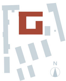
Lage des Hauses