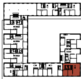
Lage der Wohnung

BVK Postfach 8090 Zürich 058 470 47 00 www.bvk-immobilien.ch www.sidiareal.ch