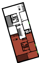
Lage der Wohnung

BVK Postfach 8090 Zürich 058 470 47 00 www.bvk-immobilien.ch www.sidiareal.ch